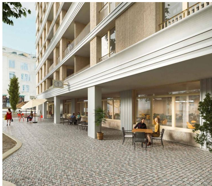
Route des Acacias